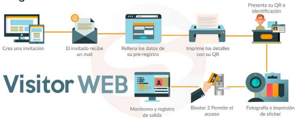
Diagrama de funcionamiento